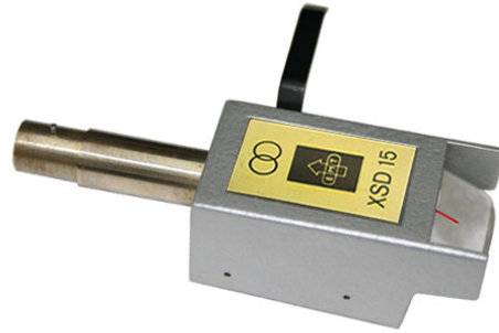
XSD15 SFL/LZ H

"The new low output, low impedance, normal tracking force, high audio quality mc-cart from EMT"